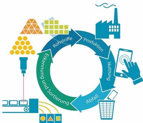
Bild 2: Der Weg in die Kreislaufwirtschaft führt über geschlossene Materialkreisläufe ohne Downcycling. Mit dem LIBS-Verfahren entwickelt das Fraunhofer ILT einen wichtigen technologischen Baustein dafür.