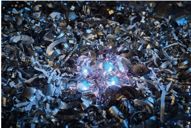
Bild 3: Analyse von Metallschrott mittels Laser-induced Breakdown Spectroscopy LIBS.