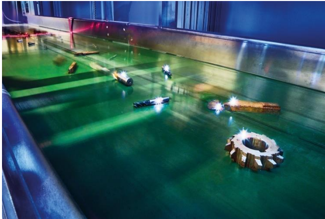
Bild 1: Die Laser-induced Breakdown Spectroscopy LIBS detektiert wertvolle Legierungen in Metallschrott, den Roboter sortenrein trennen. Das Verfahren schafft die Grundlage für geschlossene Stoffkreisläufe ohne Downcycling.