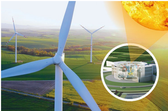
Bild 2: Fusionsenergie: saubere und nahezu unerschöpfliche Energiequelle der Zukunft.