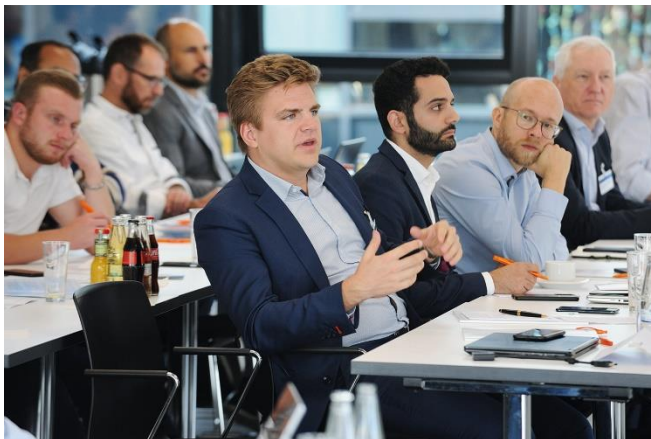
Bild 4: Insider-Event der Wasserstoff-Community: 70 Teilnehmende trafen sich im Herbst 2023 auf dem 4. Laserkolloquium, um neue Wege bei der laserbasierten Wasserstoffproduktion kennenzulernen.